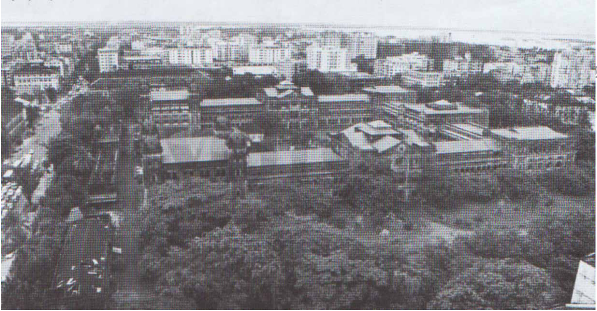
လမ်းဆွဲခွဲခွဲလှည့် တီးဝိုင်းယခင်ရှင်,(တီးကန် ထင်းထမ်းထုခင်း လီးထွန်းယိုဝင်းတံ)ကန်လီးရှင်ယူ၊ မိုင်းလီဝ်

ခင်းရှင်ရှင်လှည့်လှည့်ခင်းခင်း တီးကန်ထင်းထမ်းထုခင်းခင်းခင်း ထမ်းတင်းဟင်းတူလှည့်ပိုခင်း။ ထိုင်းတိုင်းမတ်၊ရှင်၊ရှင်၊ရှင်၊ သေ ကမ်းတံ၊ဝမ်းလီဝ်ခင်းခင်း ရှိုတ်းထင်းထမ်းထုခင်း ခလး၊ ကူးပု၊ချိုဝ်၊။ တိုင်းမတ်၊တီးရှင်၊ရှင် ထင်းထမ်းထုခင်း သွင်ခင်းသေ တု၊ ခတ်းထိုထိုခင်းလှည့်ပိုမားထူး ရှင်ခင်းထိုင်းခင်းမားထူးထိုင်းခင်း ရှင်ခင်းခင်း။ ငုတေလှည့်ယဝ်.ခလး၊ ရှင်ခင်းထိုင်းခင်းမားခင်း။ လီးဟေ ဟိုင်းမခင်းရှု၊ ခင်းကိုင်ဟေဝ်။ လှည့်တီးသုပမ်းမခင်းထင်း လှိုတ်းလီလှည့်မားတင်းခင်းသေ ယွခင်းဂိုခင်းခင်း။ ဝါးခင်း ကွခင်းခင်း သုင်၊ ထင်းထမ်းထုခင်း ခလး၊ ကူးပု၊ချိုဝ်၊ ရှု၊တီးရှင်ယုလှည့်ယခင်ရှင်၊။ ကူးပု၊ချိုဝ်၊ခတေ။ သိုင်းရှင်၊ရှု၊ မိုင်းဝါးဝခင်းခင်းသေ ထင်းထမ်းထုခင်းခတေ။ ထိုင်မိုင်းလှည့်ခင်းရှု၊လီ၊ 20 ဝခင်းထင်၊ ခွခင်းခင်းရှု။